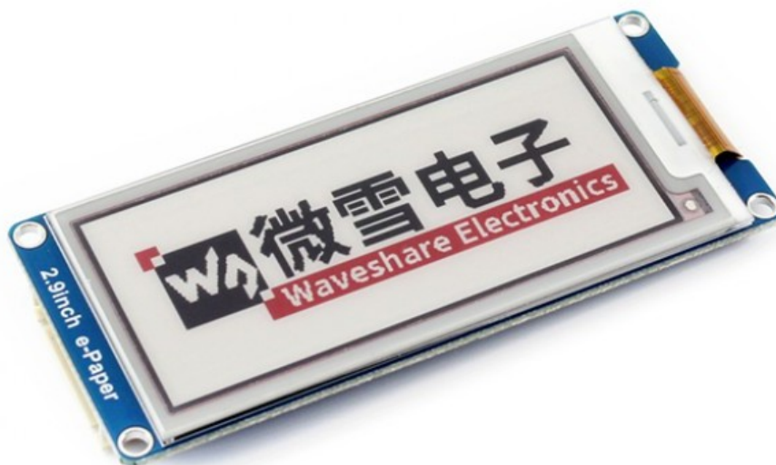
1. Ilustrace: černočervenobílý e-paper s rozlišením 296x128 bodů

Sortiment displejů jsme rozšířili o e-ink (e-paper) a TFT displeje. TFT displeje jsou vybavené rozhraním HDMI pro snadné propojení s minipočítači jako například Raspberry Pi. E-ink (e-paper) moduly se připojují přes SPI rozhraní.